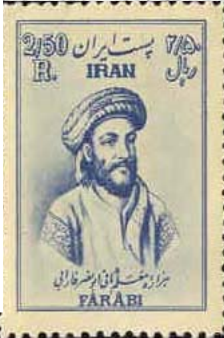
Book of al-Madînah al-Fâdilah