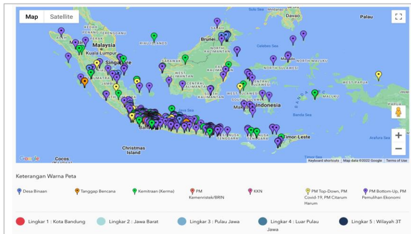
Gambar 3. Menampilkan 1800 lebih sebaran kegiatan Pengabdian Masyarakat ITB yang cenderung terpusat di wilayah Jawa Barat, menampilkan sebaran kegiatan pengabdian masyarakat ITB belum menysasar wilayah 3T, perbatasan RI, termasuk wilayah timur Indonesia.