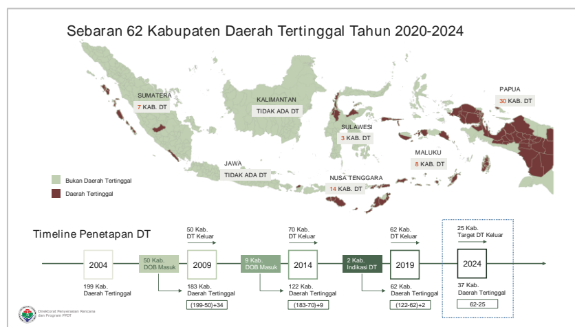
Gambar 3. Sebaran prioritas 62 kabupaten daerah tertinggal tahun 2020-2024 (sumber: Kemendes).